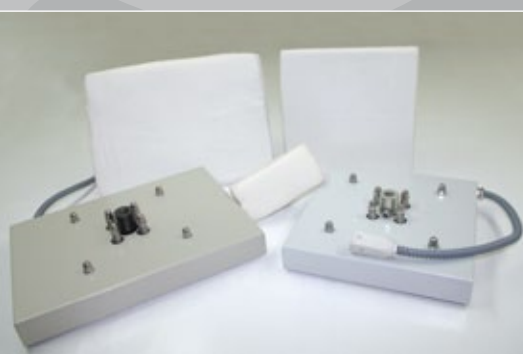
opciones de platos